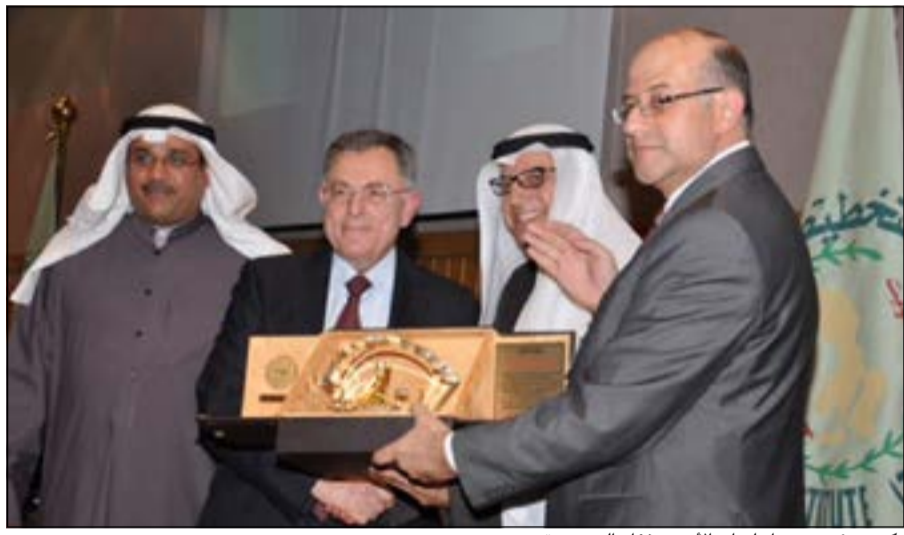
تكريم رئيس وزراء لبنان الأسبق فؤاد السنيورة

نظرا للأمل المعقودة على هذه الشبكة في المستقبل ودورها المتوقع في مجال التدريب وتعزيز القدرات البشرية، وأعادت أرسية التأكيد على أن الحكومة الفرنسية ستواصل دعمها لكافة المبادرات البناءة.